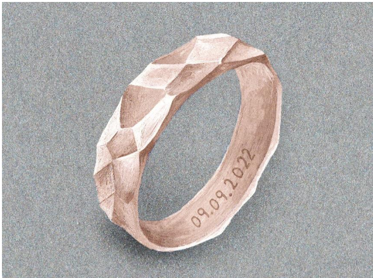
Ring in Roségold